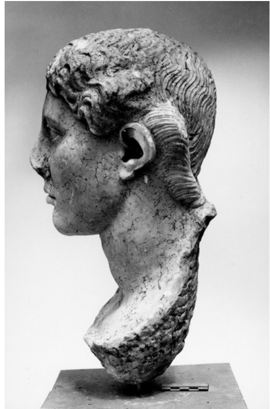
15. Athènes, Musée de l'Agora S 1631, portrait de femme.

le visage est encadré de mèches ondulées travaillées autrement que la chevelure sur le crâne 7 .